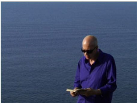
Hors du soleil, des baisers et des parfums sauvages

■ Jean-Philippe TOUSSAINT a choisi de lire Noces et L'été d'Albert CAMUS ainsi qu'un extrait de son livre Fuir , filmé par Ange LECCIA.